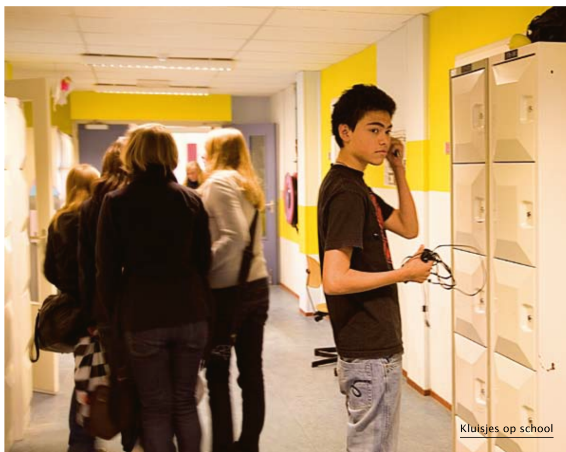
Kluisjes op school